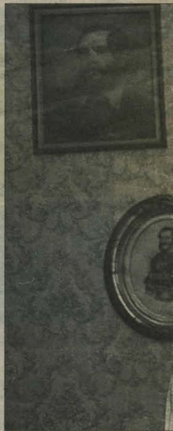
A Kossuth család tagjai olyan konzen

részt vett a tiltakozó nyilatkozat megfogalmazásában. – Nem árulok el titkot – fogalmazta meg véleményét a fiatal médiajogász –, több mint egy évtizede figyelem a szabad demokraták tevékenységét. Annak idején, 1988-ban elolvastam a programalkotó nyilatkozatukat, abban szintén hivatkoznak Kossuth Lajosra, miszerint szellemi elődjüknek tekintik Kossuthot. Kíváncsian vártam, hogy milyen politikát fognak folytatni. De meggyőződésem, és ez családom meggyőződése is – erősítette meg dr. Kossuth László –, hogy a Kossuth által képviselt nemzeti liberalizmusnak és a szabad demokraták által hangoztatott liberalizmusnak nincsen semmi köze egymáshoz. Ezt például is tudom érzékelteni. Az SZDSZ jelenlegi elnöke 1997 őszén belügyminiszter volt. Akkor történt az a híres Metész-tüntetés, amikor a rendőrség idős embereket ütött meg és brutálisan szétverték a tüntetőket. Kérdezem azt, hogy miféle liberalizmus az, amikor az alapvető szabadságjogokat nem lehet gyakorolni egy állítólagos liberális párt által vezetett Belügyminisztérium és az általa irányított rendőrség miatt. Tehát nekem nem az a problémám – hangsúlyozta dr. Kossuth László –, hogy valamelyik párt megemlékezik Kossuth Lajosról, hanem az a problémám, hogy ezt egy választási propagandára kívánják felhasználni, ki akarják sajáttítani a kossuthi politikát, illetve a Szabad Demokraták Szövetsége most úgy próbálja meg beállítani a saját politikáját, mintha az a kossuthi gondolatok