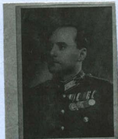
Az 1974. tavaszi BL-ben e róli. A két fényképét özvegye