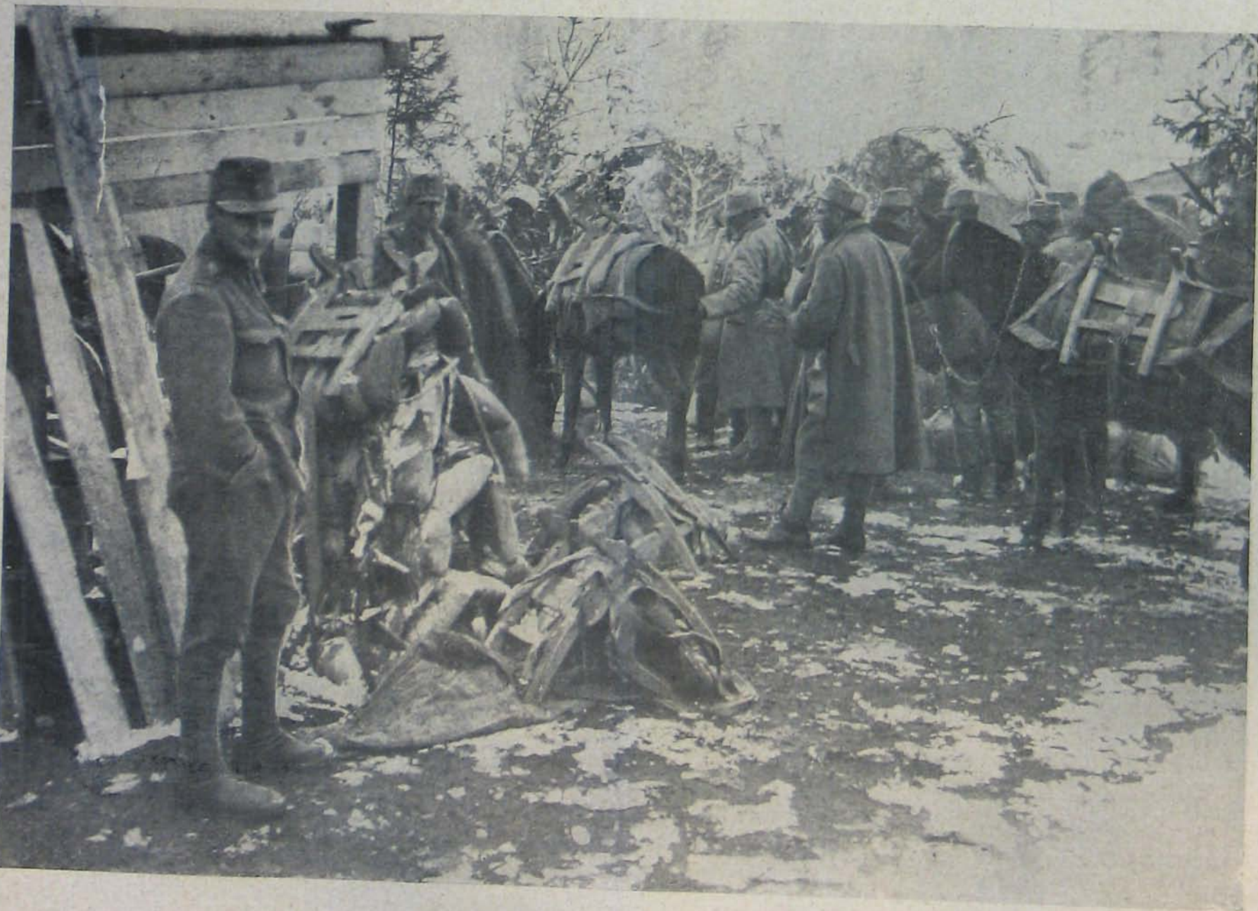
Az északi harcztérről. — Teherhordó csapatok túl orra.