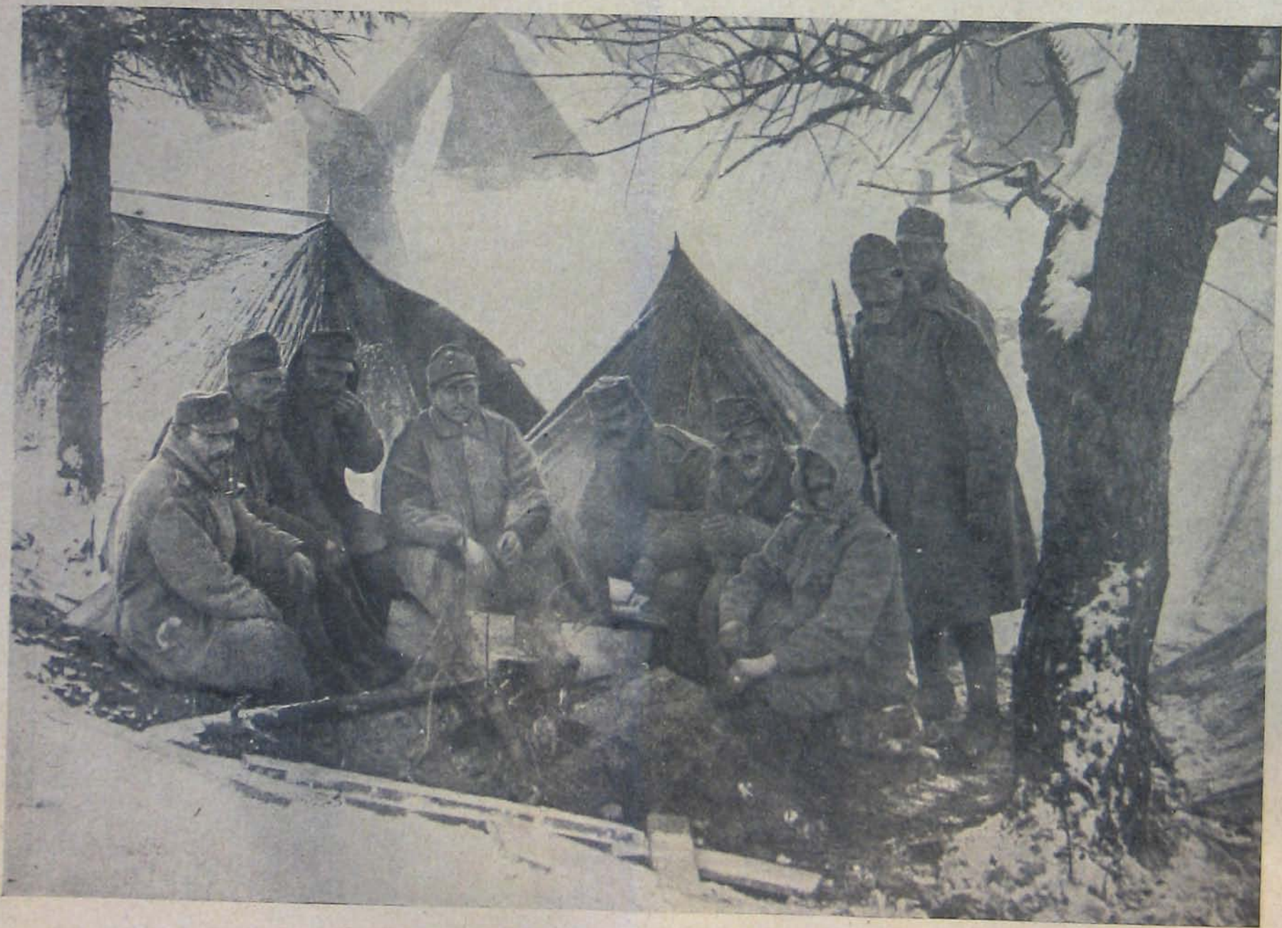
Az északi harcterről. — Tábortűznél a Kárpátokban.